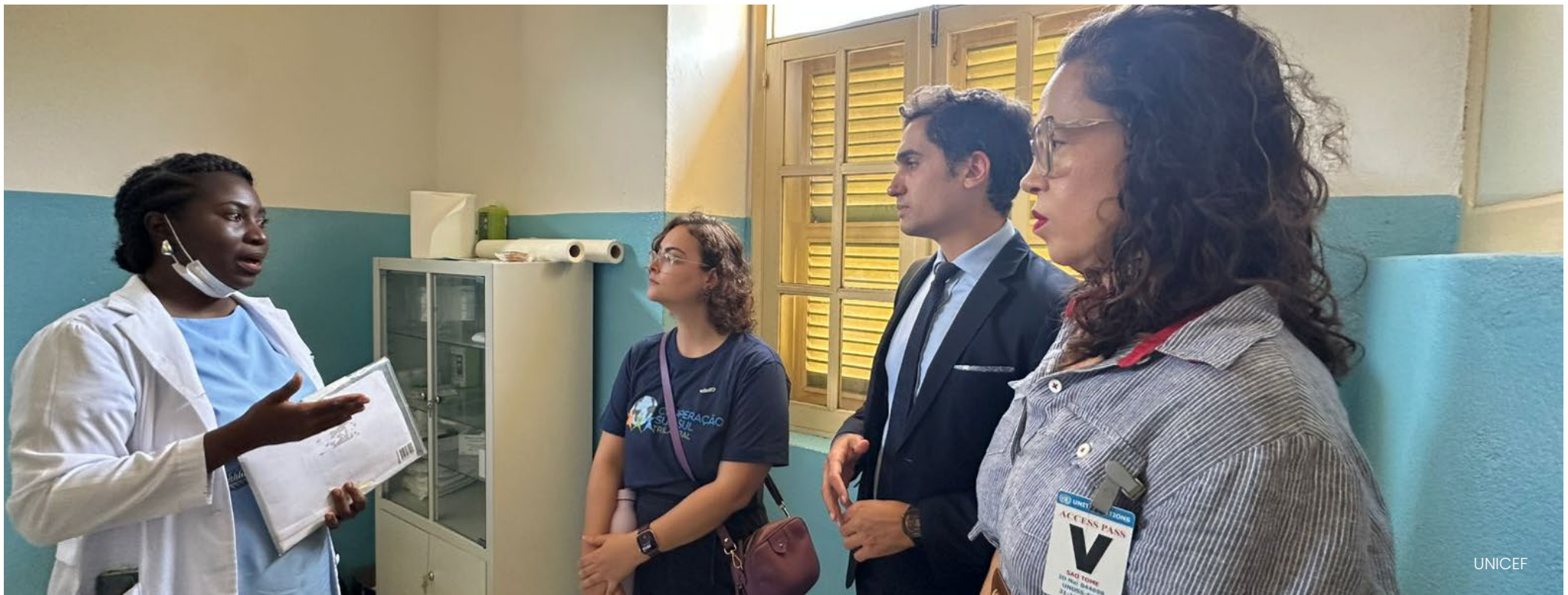
Técnicos Brasileiros visitam instalações de atendimento a crianças e adolescentes em São Tomé e Príncipe.

Já em 2025, em momento de finalização do projeto, a delegação do Brasil acompanhou avanços concretos realizados em São Tomé e Príncipe, como a implementação de espaços adequados para a escuta de crianças vítimas ou testemunhas de violência.